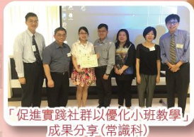
「促進實踐社群以優化小班教學」成果分享(常識科)