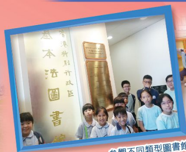
參觀不同類型圖書館

推動閱讀：在下午課時內增設中英文閱讀課，為學生創造閒空間，同時圖書組舉辦不同形式的閱讀活動，全面營造閱讀氛圍。