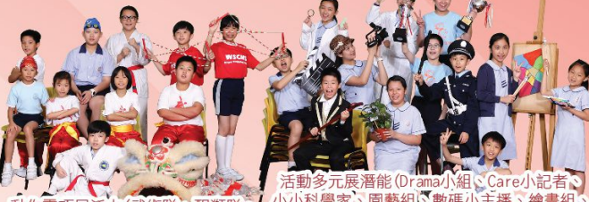
活動多展潛能(Drama小組、Care小记者、小小科學家、園藝組、數碼小主播、繪畫組、辯論小組、M-bot機械人) 動作靈巧展活力(武術隊、醒獅隊、花式跳繩隊、跆拳道、游泳隊)