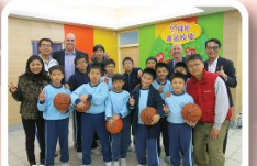
美國 Woodford Country 教育局代表訪校