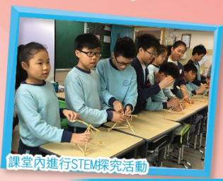
課堂內進行STEM探究活動