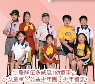
制服隊伍多威風(幼童軍、小女童軍、公益少年團、少年警訊)