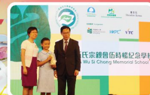
學校歷年參加教育局及大專院校不同協作計劃，累積多方面的經驗，不時獲邀對外分享。