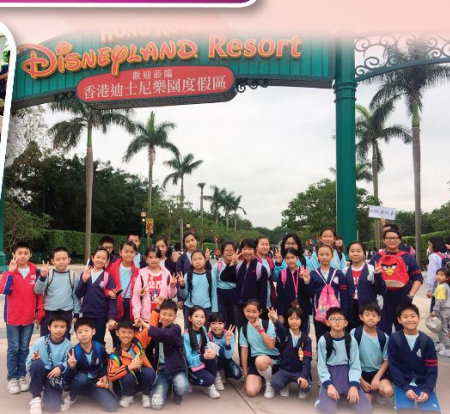
迪士尼環境教育體驗行