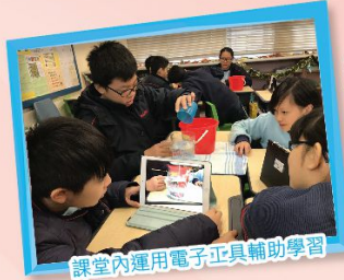
課堂內運用電子工具輔助學習

發展電子科研：課程內加插電子學習，令課堂互動有趣，並積極發展STEM教育，提升學生創意解難能力。