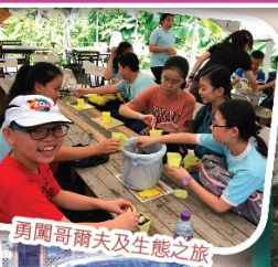
勇闖哥爾夫及生態之旅