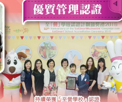
持續榮獲「至營學校」認證