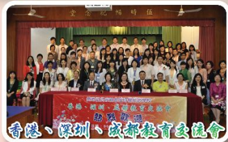
香港、深圳、成都教育遠流會 兩岸三地過百位同工觀課交流