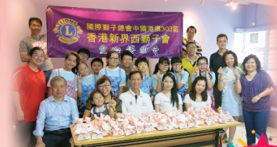
校友會參與社區服務