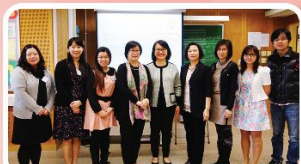
「以行求知」經驗分享會(英文科)