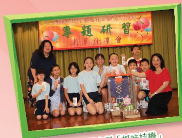
學生專題研習自製「抓娃娃機」