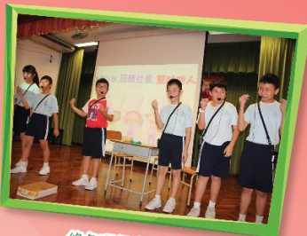
綠色環保專題研習