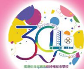
優異獎 1D 黃煥楠