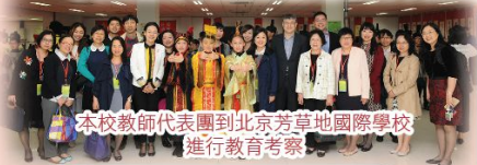
本校教師代表團到北京芳草國際學校進行教育考察