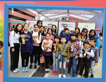
學生參加不同閱讀活動