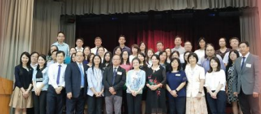
價值觀教育學習圈計劃(訓輔組)