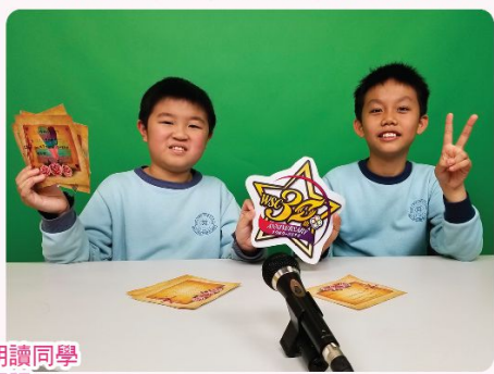
在校園電視上朗讀同學所寫的祝福語