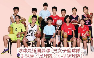
球球是道圓夢想(男女子籃球隊、手球隊、足球隊、小型網球隊)