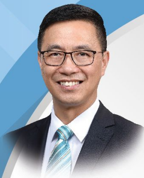
香港特別行政區教育局局長 楊潤雄太平紳士