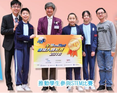
推動學生參與STEM比賽