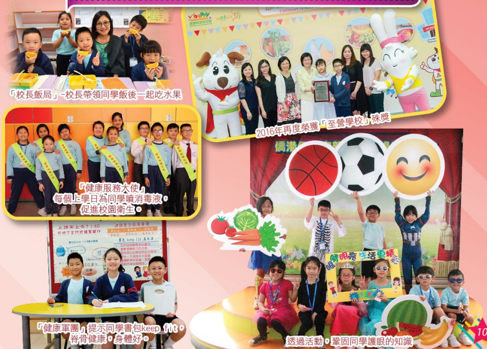
「校長飯局」-校長帶領同學飯後一起吃水果