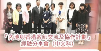
「內地與香港教師交流及協作計劃」經驗分享會(中文科)