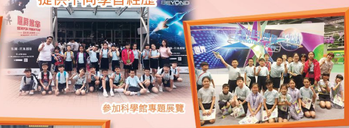
參加科學館專題展覽