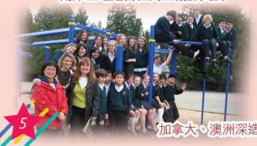
加拿大、澳洲深造英文教學