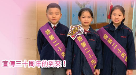
宣傳三十周年的到來!