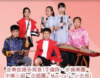
音樂悠揚多寫意(手鐘隊、步操樂團、中樂小組、合唱團、Musical、小吉他)