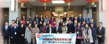
價值觀教育學習「日本交流團」