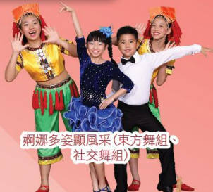
婀娜多姿顯風采(東方舞組、社交舞組)