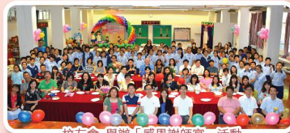
校友會 舉辦「感恩謝師宴」活動