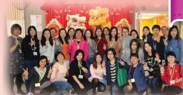
家長教師會 籌辦親子活動