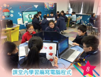
課堂內學習編寫電腦程式