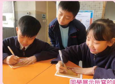
同學展示所寫的祝福語