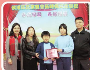
持續榮獲「關愛校園」認證