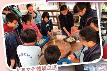
大澳文化體驗之旅