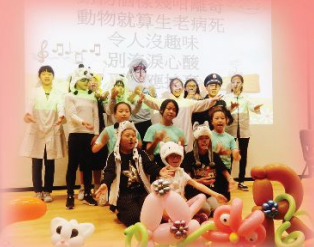
戲劇形式演繹專題研習報告