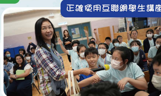
正確使用互聯網學生講座