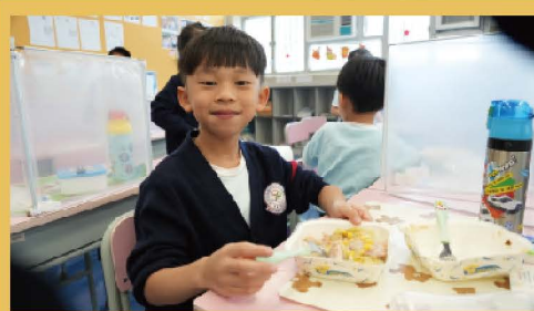
不偏食 午膳愉快開動