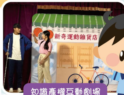
知識產權互動劇場