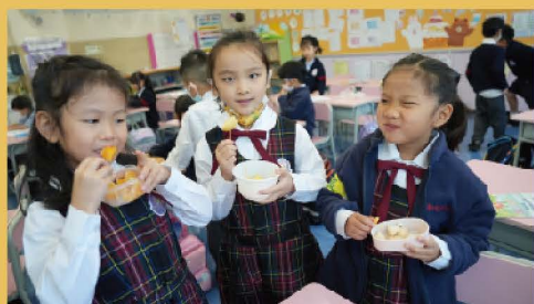
天天吃水果 疾病遠離我