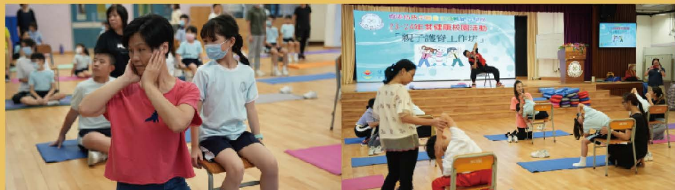
兒童脊骨基金「親子護脊工作坊」