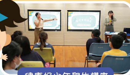
健康好少年學生講座