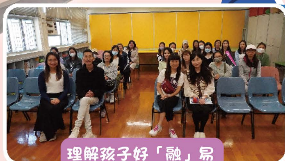
理解孩子好「融」易 家長講座