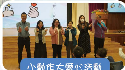
小動作大愛心活動