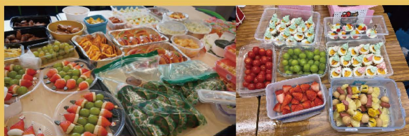
綠色健營聖誕聯歡會

健康從好習慣開始！ 學校各項推廣良好生活習慣的活動已逐一開展，例如護脊活動、健康飲食講座等，期望家長、學生積極參與，一起實踐健康生活好習慣。