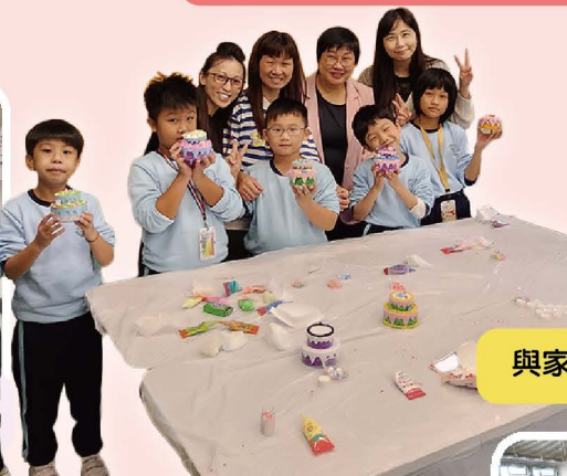
與家長義工一同製作校慶35周年蛋糕