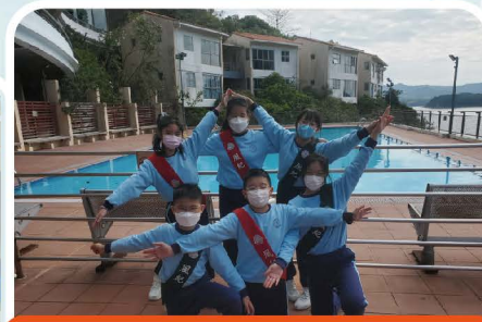
「小領袖 大挑戰」風紀訓練日營