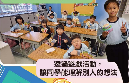
透過遊戲活動， 讓同學能理解別人的想法