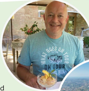
Me in Italy