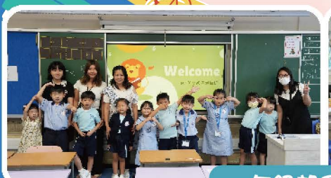
一年級親子輔導班