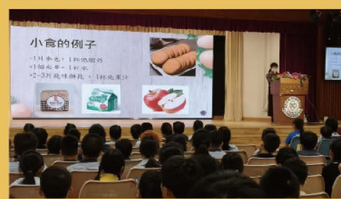
三、四年級飲食健康講座

健康從好習慣開始！ 學校各項推廣良好生活習慣的活動已逐一開展，例如護脊活動、健康飲食講座等，期望家長、學生積極參與，一起實踐健康生活好習慣。