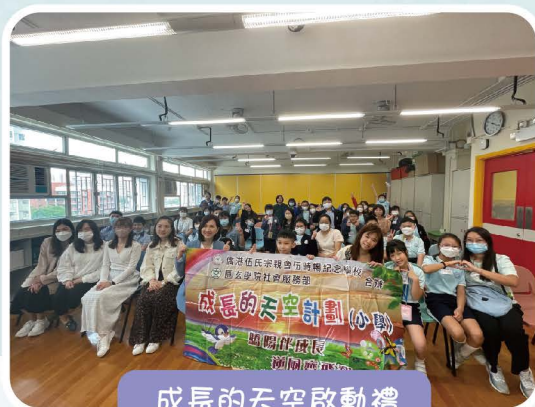
成長的天空啟動禮

本計劃由教育局撥款，學校與圓玄學院社會服務部學校支援服務隊合作，在小四至小六年級推行「成長的天空」計劃，為學生、家長及老師進行各類有關抗逆力的活動及課程。