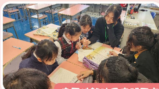
中區扶輪社及屯門天主教中學課後支援計劃