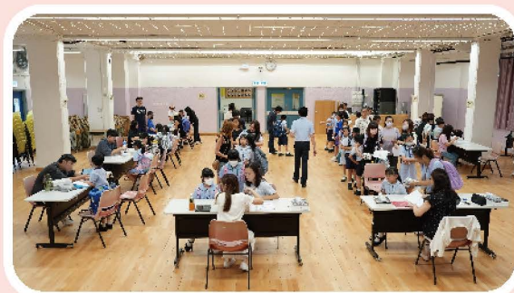
四年級同學派發平板電腦